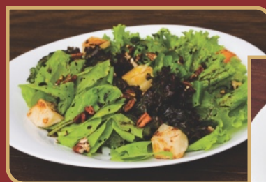
Queijo de Cabra com Pecans